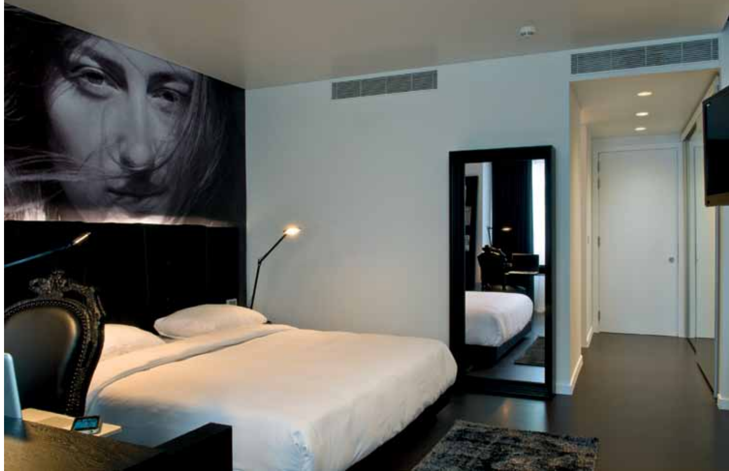
חלל חדר בגרסה השחורה: תאורה עמומה וממד דרמטי. לריצוף החללים משמש "סנסו" (בשחור/לבן) - פולימר המיושם במריחה תוך יצירת משטח חלק למשעי ללא כל תפרים.

(שחור/לבן), פולימר המיושם במריחה תוך יצירת משטח חלק למשעי ללא כל תפרים, ובעיצוב שנשען על גון אחד בלבד תאורה ומרקמי חומרים הם במידה רבה מחוללי הסיטואציה האסתטית. האור מהווה בה חומר בפני עצמו ואמצעי ה"בונה" את רובדי החלל וממדי עומקו, והמרקמים השונים מקנים עושר וויזואלי ועניין משתנה. כך, לדוגמה, בעוד בחללים הכהים תאורה רכה ועמימות הם חלק בלתי נפרד מהמארג החושני, בחללים הבהירים הם מומרים בהשתקפויות ובממדים בוהקים המעצימים את איכויות המופע הלבן. אף הטקסטילים ששולבו בעיצוב נוטלים חלק בתרגום הרעיון, ולמרות שהם נאמנים לגון אחד (לבן או שחור בהתאם לחלל) היותם עשויים מחומרים שונים בעלי מרקמים שונים מייצר סוג של "תנועה" בתמונה המונוכרומאטית, וכך גם מפגשם עם האור הנופל עליהם.