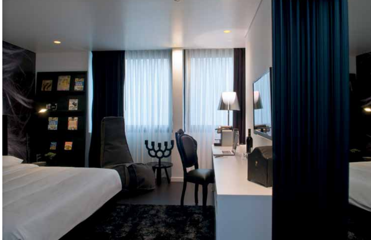
חדר מהקטגוריה השחורה, אותה הגברת בשינוי אדרת: המופע האווירי של החללים הלבנים מומר במופע עמום משהו, המדגיש את המוטיב החושני ואת האווירה הדרמטית.