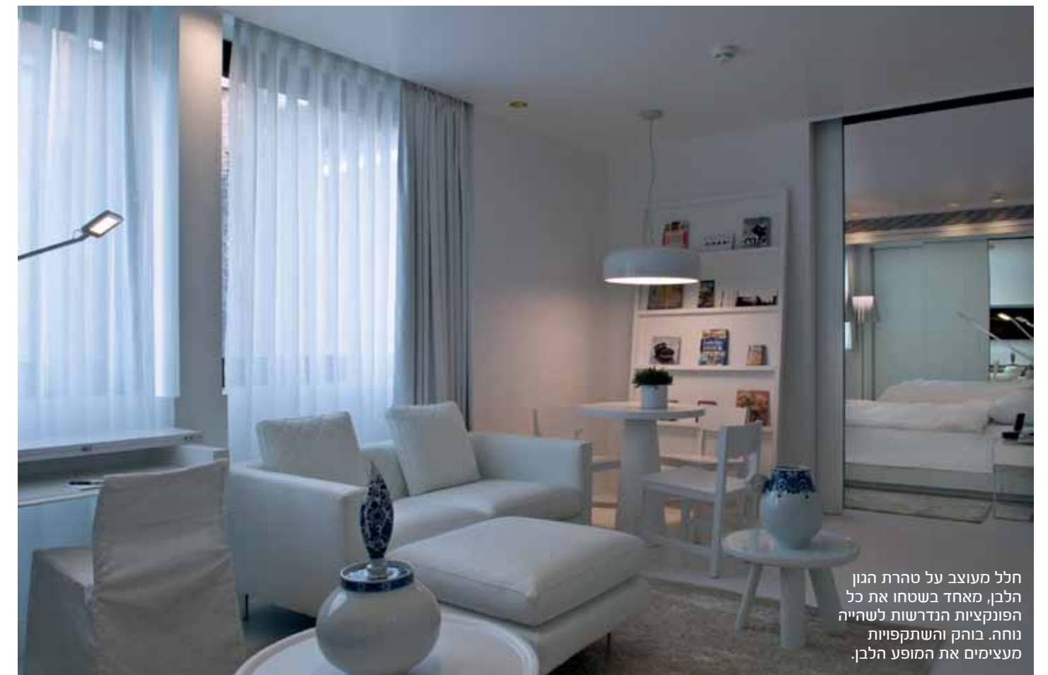
חלל מעוצב על טהרת הגון הלבן, מאחד בשטחו את כל הפונקציות הנדרשות לשהייה נוחה. בוהק והשתקפויות מעצימים את המופע הלבן.