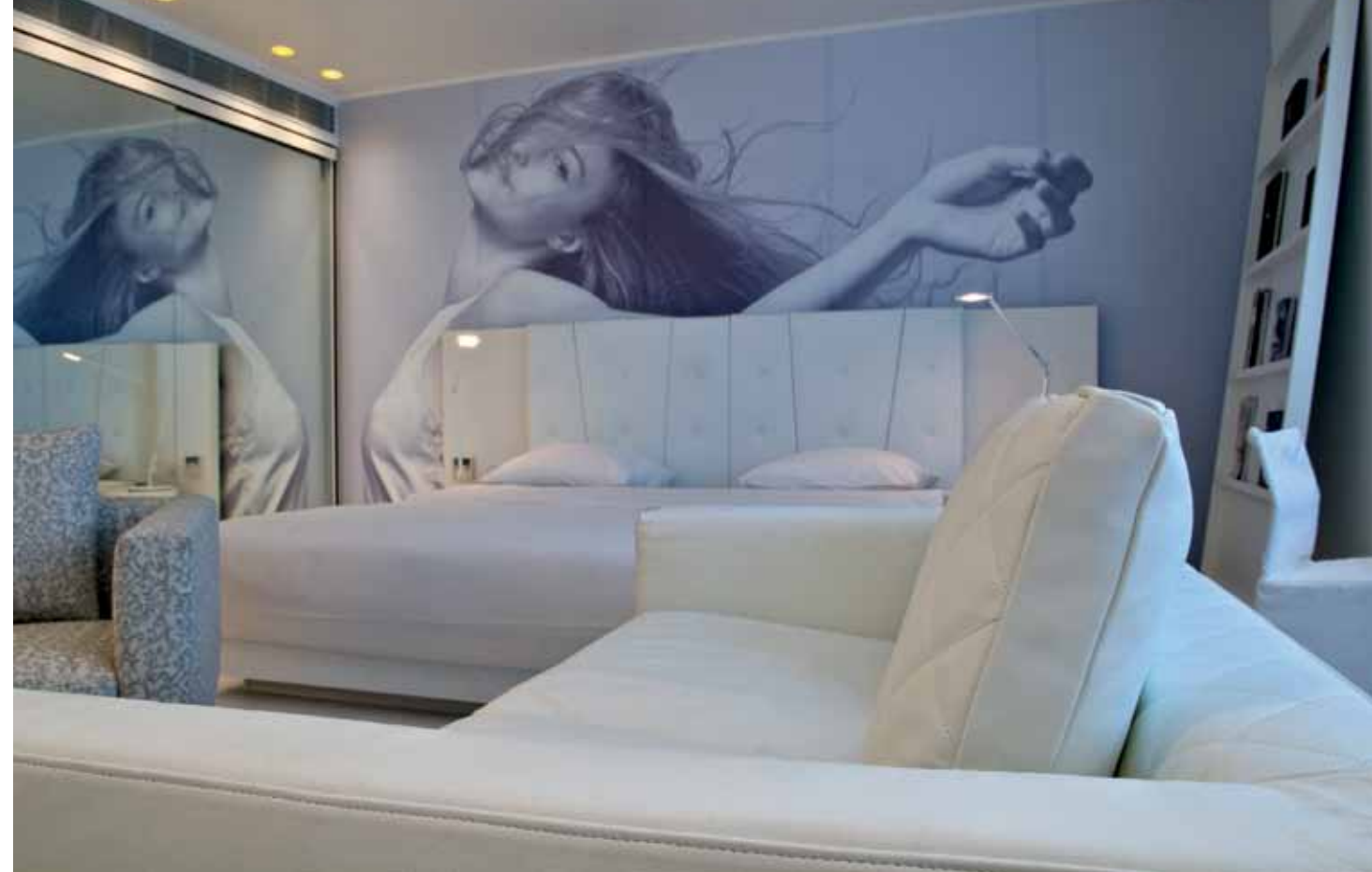
עיצוב מוקפד הנרקם משילוב איכותי של פריטי ריהוט ואביזרים. הדמות המצולמת שמשתלבת במדויק מעל המיטה יוצקת נופך של "חושניות קריירה" המשתלבת במארג הלבן ומעשירה אותו בממד נוסף, הפקה וצילום: רון קדמי .

תכנון התאורה ככלל, מספר מרום "היה מרכיב משמעותי מאד בפרויקט, ובפרט בחללים הכהים. הרבה יותר מורכב לייצר "חוסר אור" מכון מאשר להציף חלל באור, והפתרונות צריכים להיות יצירתיים ומאד מדויקים. השתמשנו בגופים של חברת פלוס, שיחד עם קרני תכלת , היבואנית בארץ, נרתמה לעניין בשיתוף פעולה מלא ולא חסכה מאמץ לסייע במימוש הקונספט".