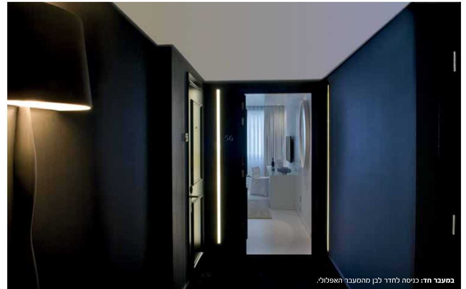
במעבר חד: כניסה לחדר לבן מהמעבר האפלולי.

"שהייה בעיר זרה יכולה לעורר תחושת משיכה אל הלא מוכר, סוג של זרות קוסמת ומרתקת שמולידה רגשות חושניים ואפילו ממד יצירי כלשהו" מסביר מרום את הבסיס הרעיוני למה שתורגם על ידו לעיצוב השחור-דרמטי. הגון הלבן מאידך, ניצב, לדידו, בצדה השני של הסקאלה, כקונטרסט מאזן לדרמה ה"אפלה" - נקי, פתוח, חושני בדרכו הקרירה-בהירה, פחות מאיים. קונספט השחור-לבן מתגלה כבר ביציאה מהמעליות אל מעברי הקומות, כסוג של רמז לבאות: בעוד המבואה שבפתחן היא בהירה יחסית, ככל שמתקדמים במעברים הופך נופם לאפלולי ורק פסים דקים המפיצים אור לבן מסמנים את הדלתות השחורות הקבועות משני עבריהם. בכניסה לדירות מתפתח הרמז וחושף את הסיפור במלואו, כאותה גברת בשינוי אדרת-שפת העיצוב בהן זהה, אך נשלטת ע"י הצבעים השונים. ריצוף החללים בוצע ב"סנסו"